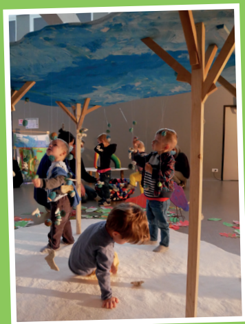
Tous Les Oiseaux : l'exposition en juin 2021.