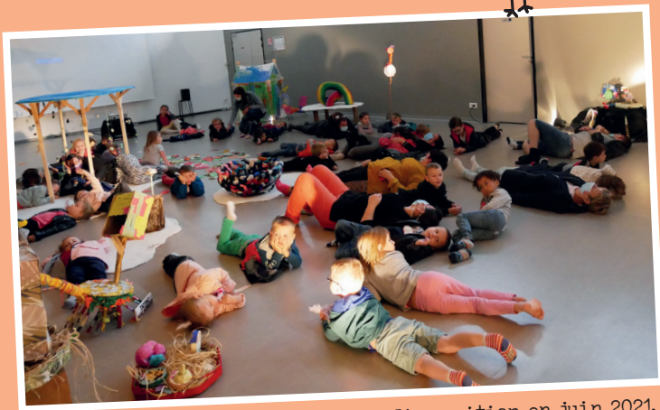
Tous Les Oiseaux : l'exposition en juin 2021.